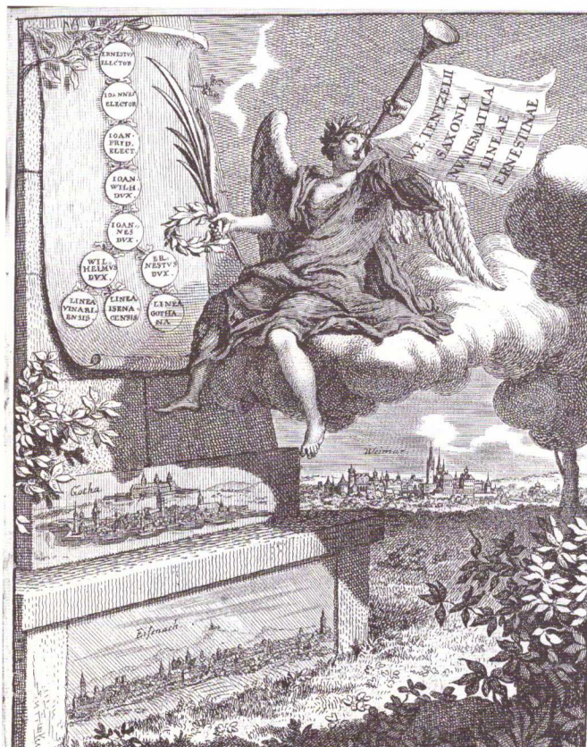
Abb. 2: Frontispiz und Innentitel zur Saxonia Numismatica, Ernestinische Linie, Teil 1, 1705

auf, und so erhielt er 1692 den Auftrag, die fürstliche Münzsammlung auf Schloss Friedenstein mit den Antiken und Münzen (sowie Medaillen) der Neuzeit zu betreuen und zu inventarisieren. In den zehn Jahren seiner Beschäftigung mit der Gothaer fürstlichen Sammlung bis zu seiner Berufung nach Dresden als Historiograph des Hauses Sachsen stu-